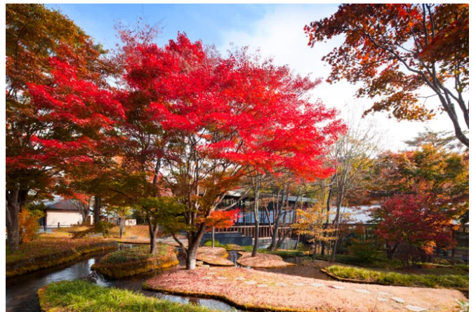
秋・星のや軽井沢「棚田ラウンジ」

四方を豊かな森に囲まれた星のや軽井沢の敷地内には、モミジやカエデ、ダンコウバイやヤマザクラなどの樹木や草花が咲き、集落の中心にある棚田には清らかな水が流れ、自然豊かなランドスケープが広がります。また、完璧に整えるのではなく、できる限りありのままの姿を残すことで、自然が織りなす豊かな表情を、より色濃く感じられるようになっていきます。そんな庭を、開業当時を知る庭師が、植物の特徴や庭に対する想いを、そして星野温泉時代から続く歴史とともに解説します。清らかな空気や自然の息吹を満喫しながら、谷の集落で心安らぐひとときを過ごすことができます。