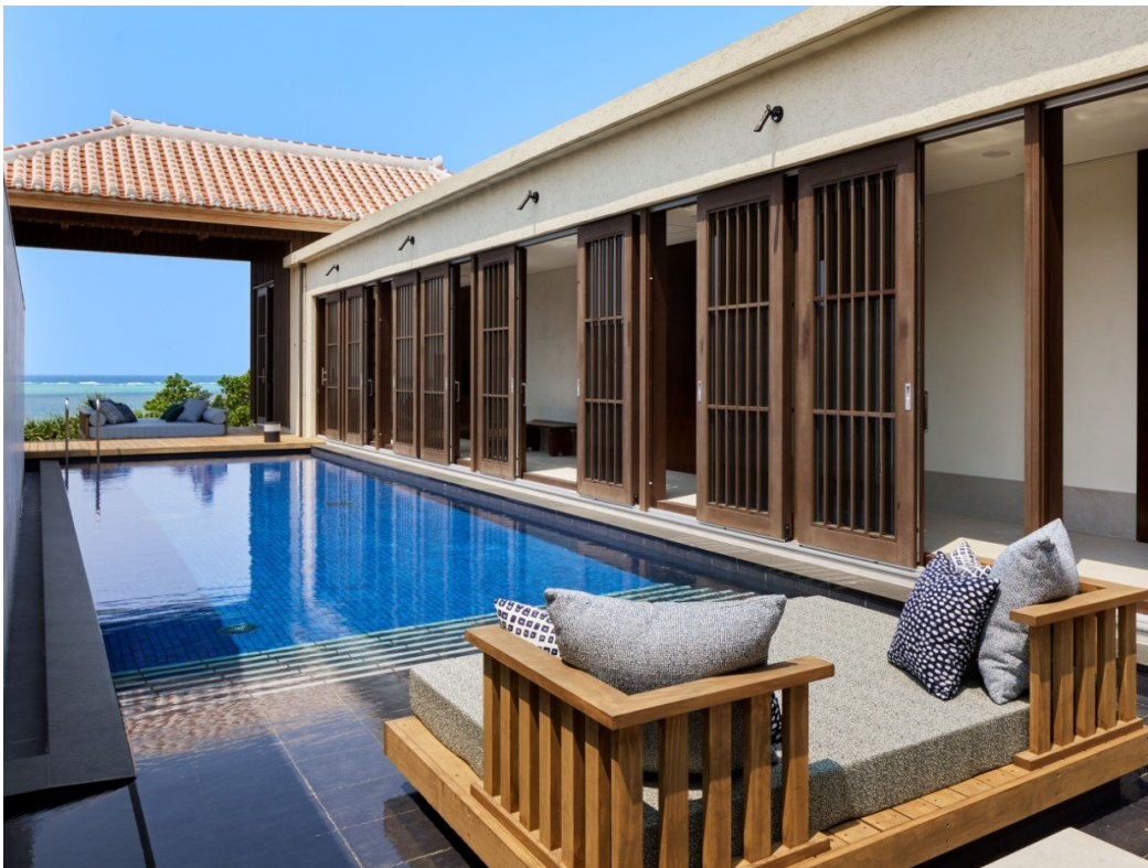
星のや沖縄 特別室「ティーダ」