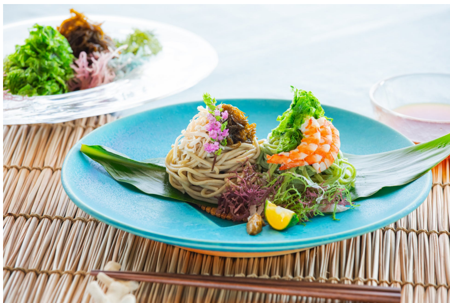
麺打ちで作るもずく麺とアーサー麺

*1 竹富島で医者がいなかった時代に薬の代わりに用いられたハーブや野菜類の総称。