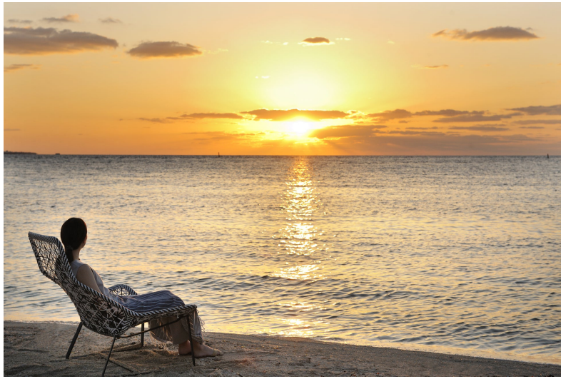
ゆったりと波音を聴く風景