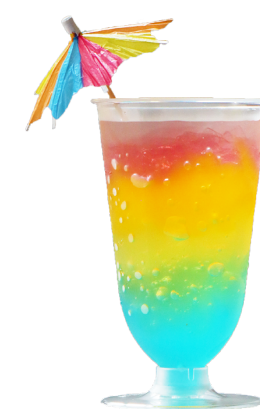
にじいろゼリー Rainbow Jelly ¥748