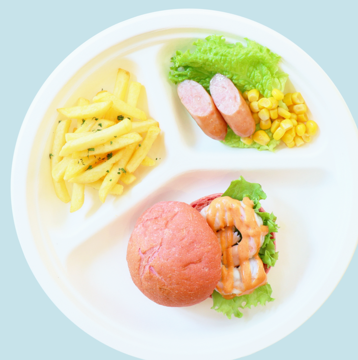
えびバーガー Shrimp Burger