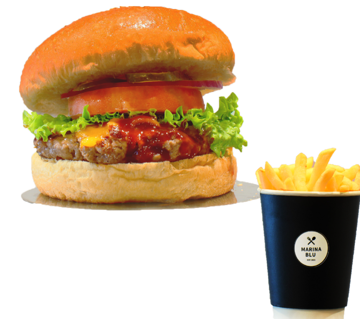
BBQソースバーガー (ポテト付) BBQ Sauce Burger ¥1,663