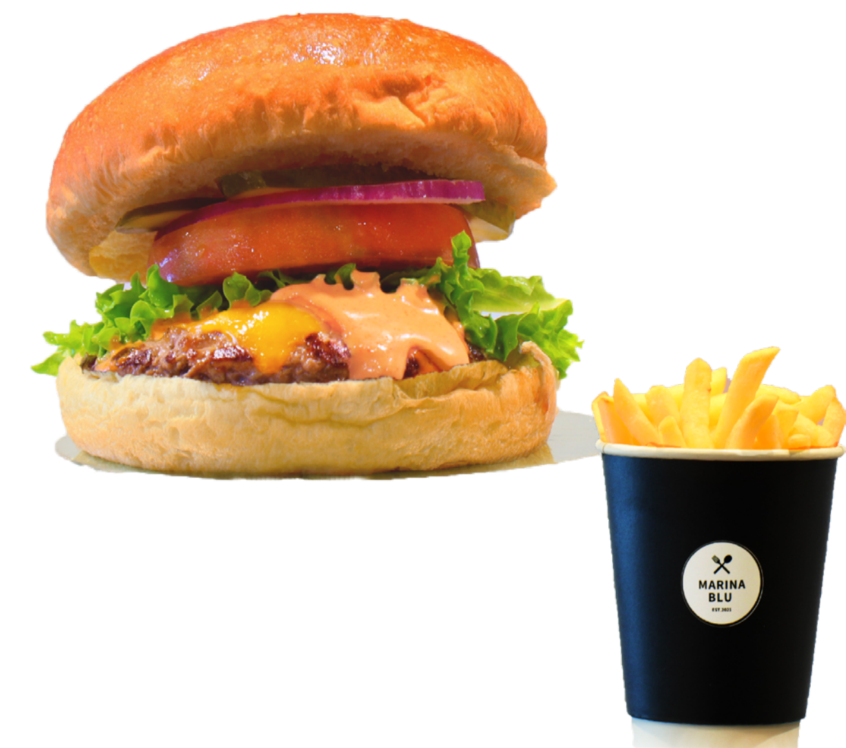
オーロラソースバーガー (ポテト付) Aurora Sauce Burger ¥1,663