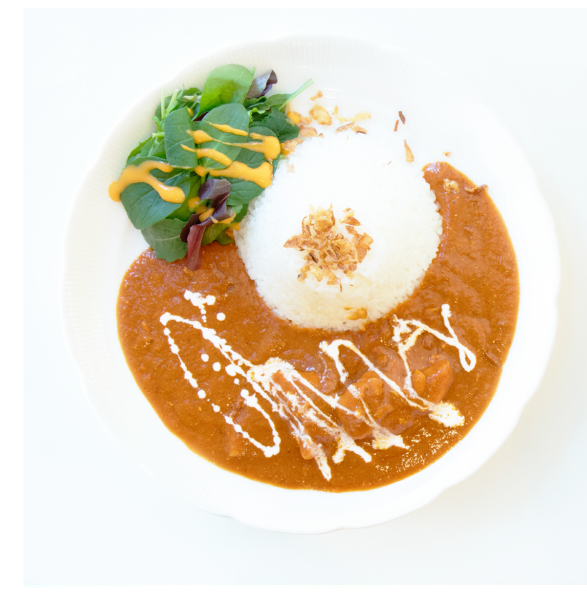
バターチキンカレー Butter Chicken Curry ¥1,512