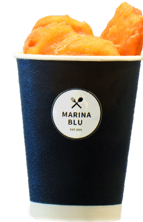
チキンナゲット Chicken Nugget ¥726