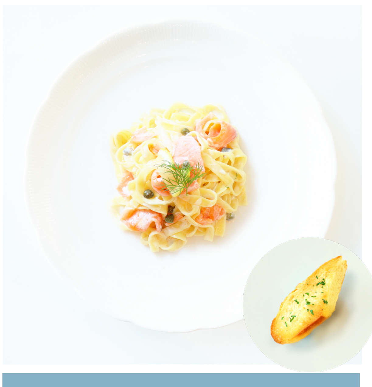
サーモンのクリームパスタ (バケット付) Salmon Cream Pasta ¥1,793