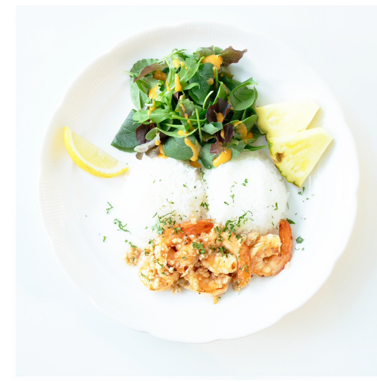
ガーリックシュリンプ Garlic Shrimp ¥1,985