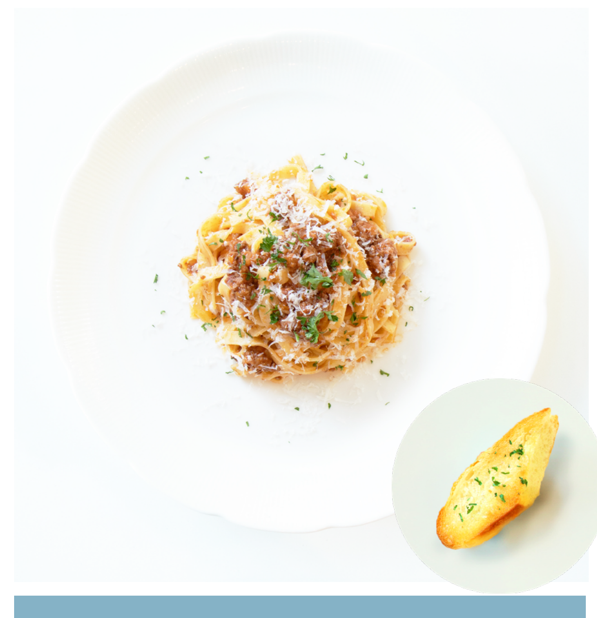
ボロネーゼ (バケット付) Bolognese ¥1,793