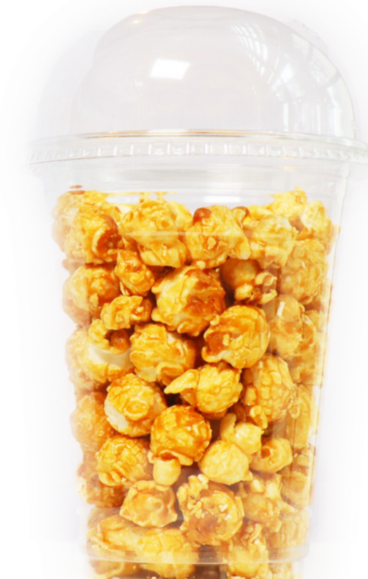
キャラメル ポップコーン Caramel Popcorn ¥588