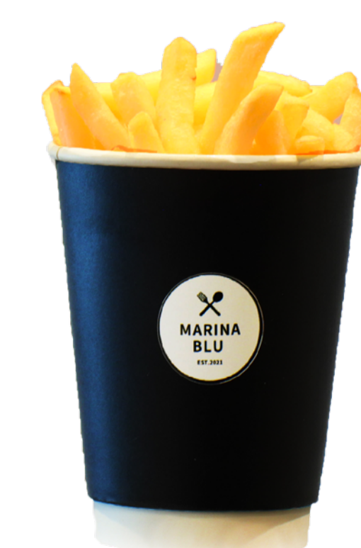
フライドポテト French Fries ¥616