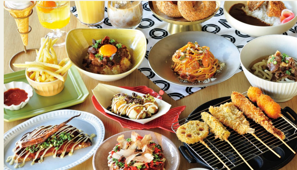
※写真はイメージです (The photo is an image only.)